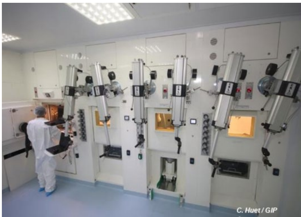
Production et purification de radionucléides au sein du GIP ARRONAX

Parmi les plus de 3000 radioisotopes différents synthétisés en laboratoire par les chercheurs, seule une poignée est régulièrement utilisée à des fins médicales, essentiellement pour l'imagerie. L'une des principales difficultés pour la mise au point de nouveaux radiopharmaceutiques reste l'accès à des radionucléides pendant les phases de développement et de recherche biomédicale. Dans le cadre de PRISMAP – le programme européen sur les isotopes médicaux –, cette phase de développement va être facilitée grâce à la mise à disposition de nouveaux radio-isotopes hautement purifiés pour la recherche médicale.